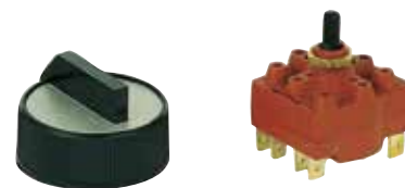
Fissaggio con dado

Per termoconvettori e fancoils (tre posizioni + zero)