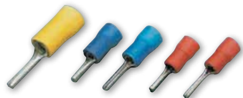
TUBETTO PVC AUTOESTINGUENTE