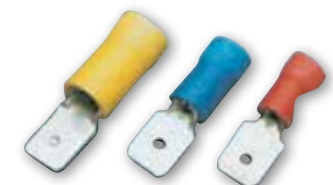
TUBETTO PVC AUTOESTINGUENTE